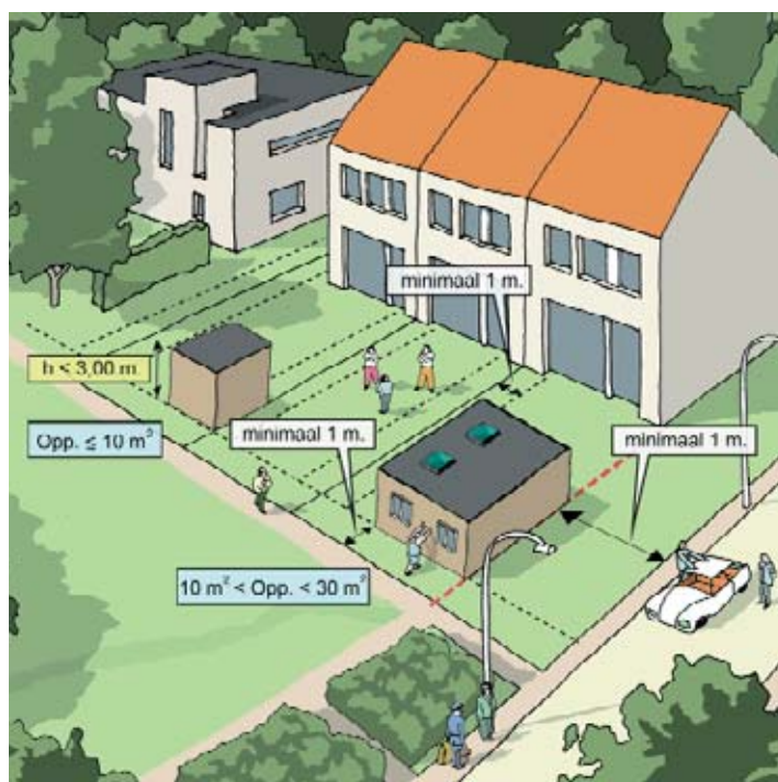
In deze gevallen mag u deze bijgebouwen bouwvergunningsvrij plaatsen.