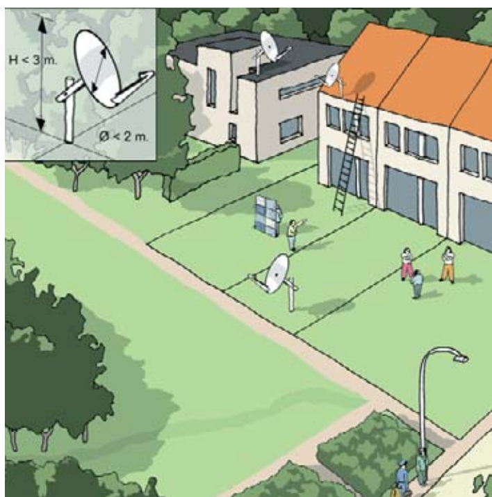
In deze gevallen mag u bouwvergunningsvrij een schotelantenne plaatsen.

in pandig balkon aan de voorkant is zonder bouwvergunning slechts mogelijk als de antenne achter de voorgevel wordt geplaatst.